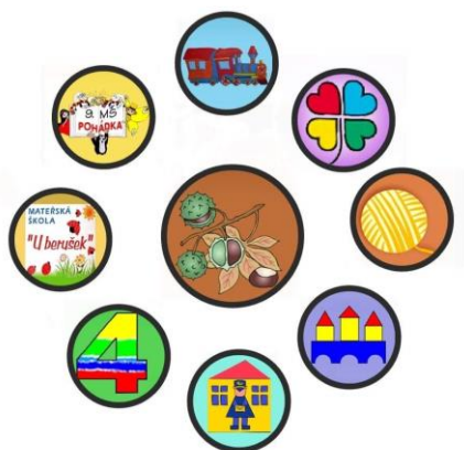
Logo mateřské školy Jirkov